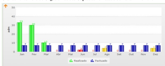
Gráfico 1: Número de Órgão e Tecidos Captados no Estado do Pará - Ano 2020